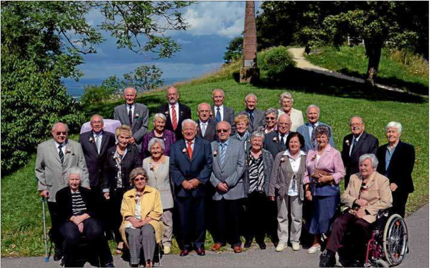
Die 80er Jubilare vom Jahrgang 1931