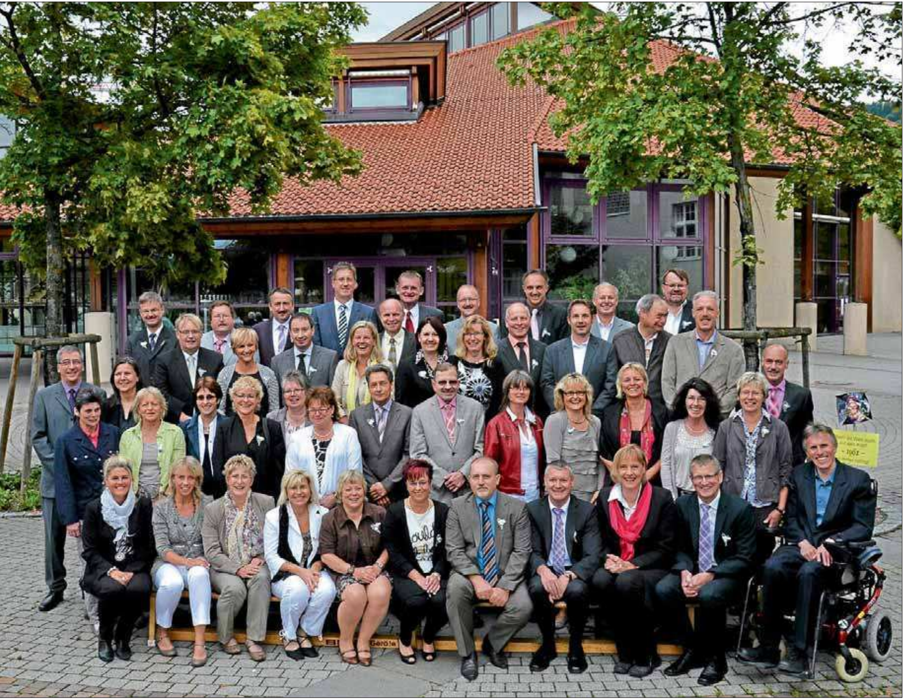
Die 50er Jubilare vom Jahrgang 1961