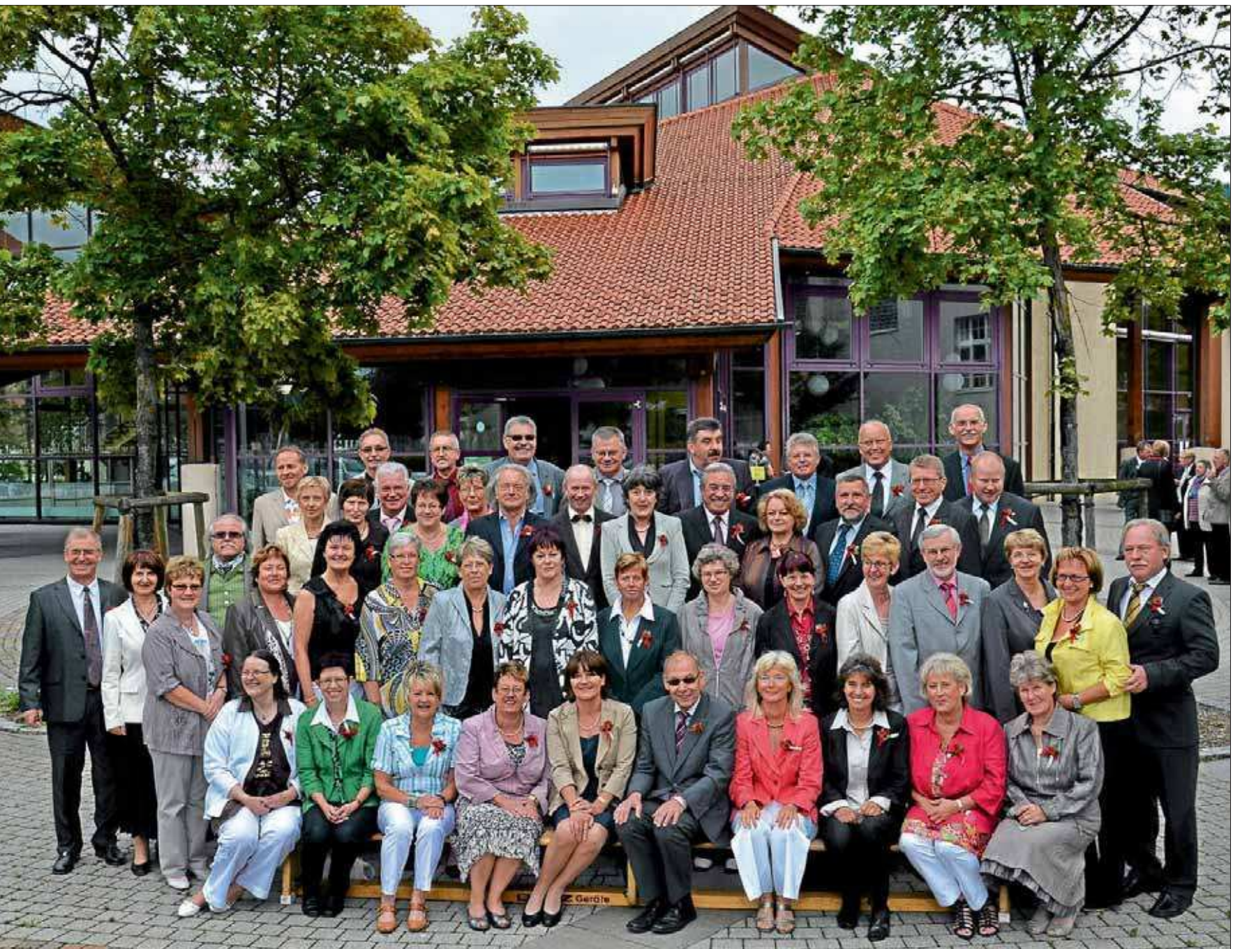
Die 60er-Jubilarer vom Jahrgang 1951