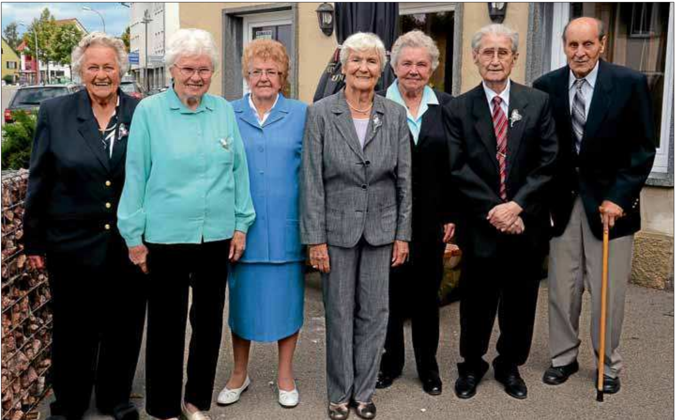
Die 90er Jubilare vom Jahrgang 1921