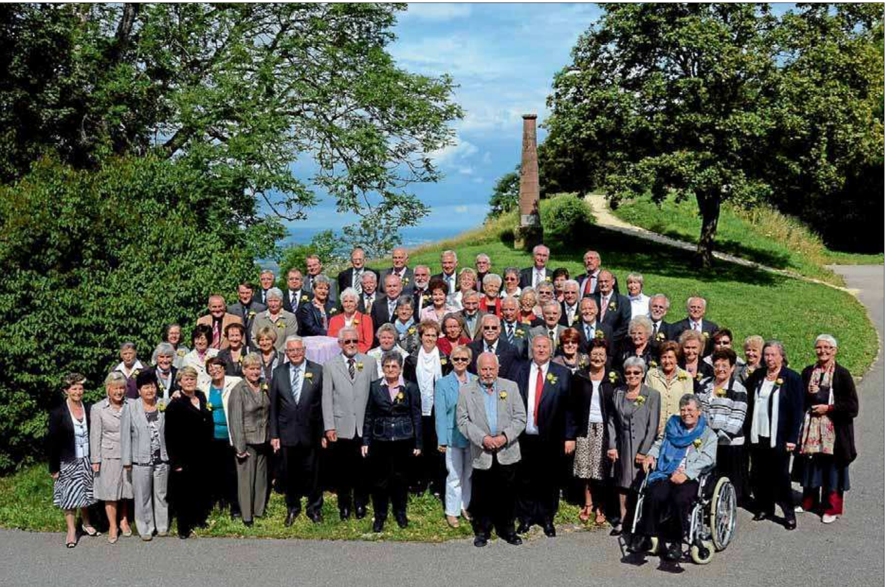
Die 70er Jubilare vom Jahrgang 1941